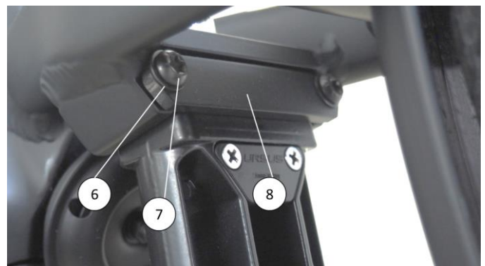
Abb. 2 / fig. 2